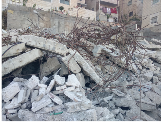
ركام منزل في حي آل عليان