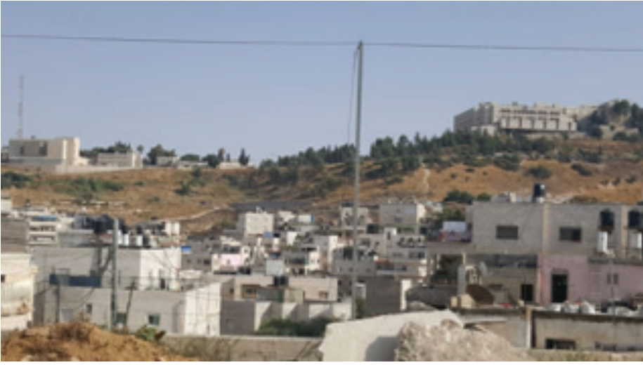
يظهر في الصورة مبنى الجامعة العبرية.